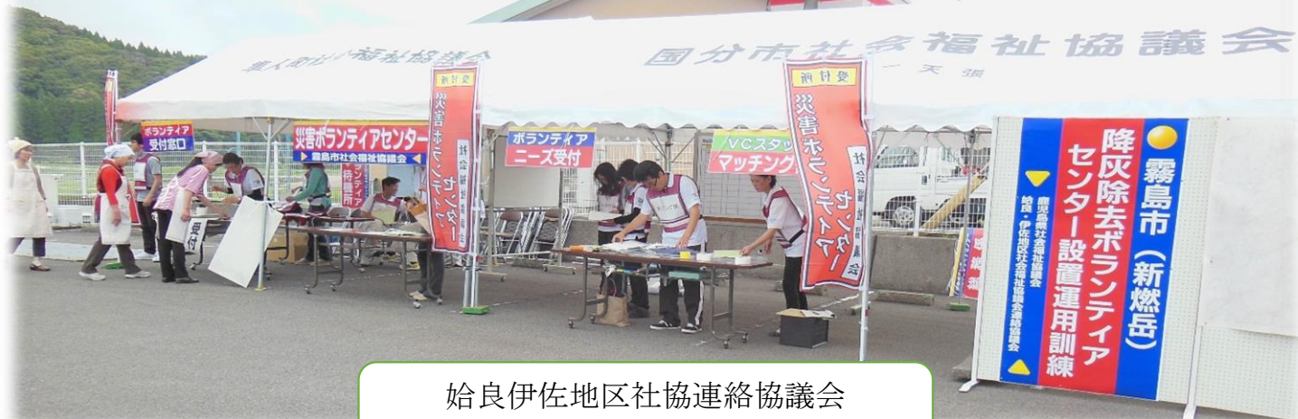
始良伊佐地区社協連絡協議会 災害ボランティアセンター設置訓練

編集・発行: 社会福祉法人 伊佐市社会福祉協議会 【菱刈本所】伊佐市菱刈前目711-1(まごし館) TEL:0995-26-4120 FAX:0995-26-4783 E-mail:kotob019@po.minc.ne.jp 【大口支所】伊佐市大口元町14-1 TEL:0995-23-0011 FAX:0995-23-0135 E-mail:ookuchicityshakyou@violin.ocn.ne.jp