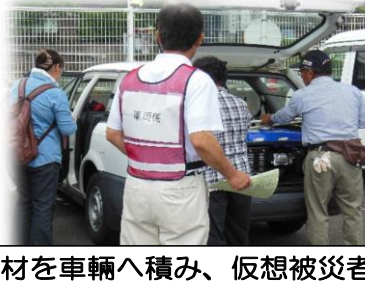
資材を車輛へ積み、仮想被災者宅へ