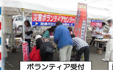
ボランティア受付