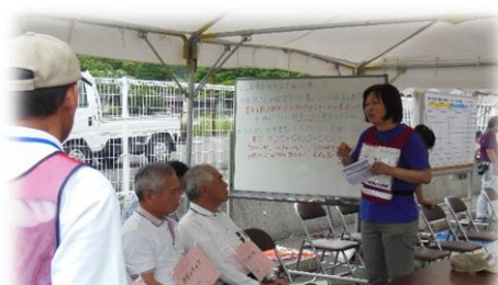
ボランティアの心構え説明