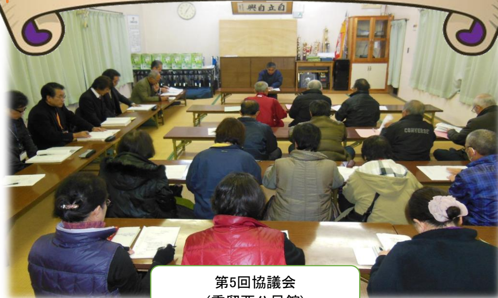
第5回協議会 (重留西公民館)