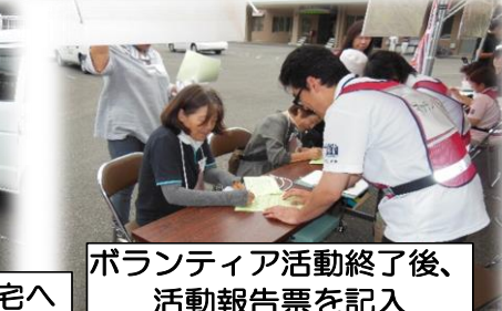
ボランティア活動終了後、 活動報告票を記入