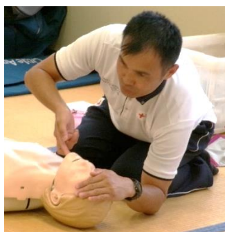
✧日赤指導員による講習