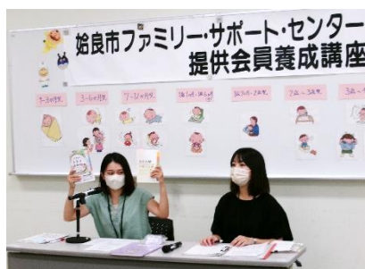
✧始良市保健師による講習