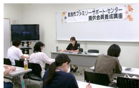
✧「センターのしくみ」について