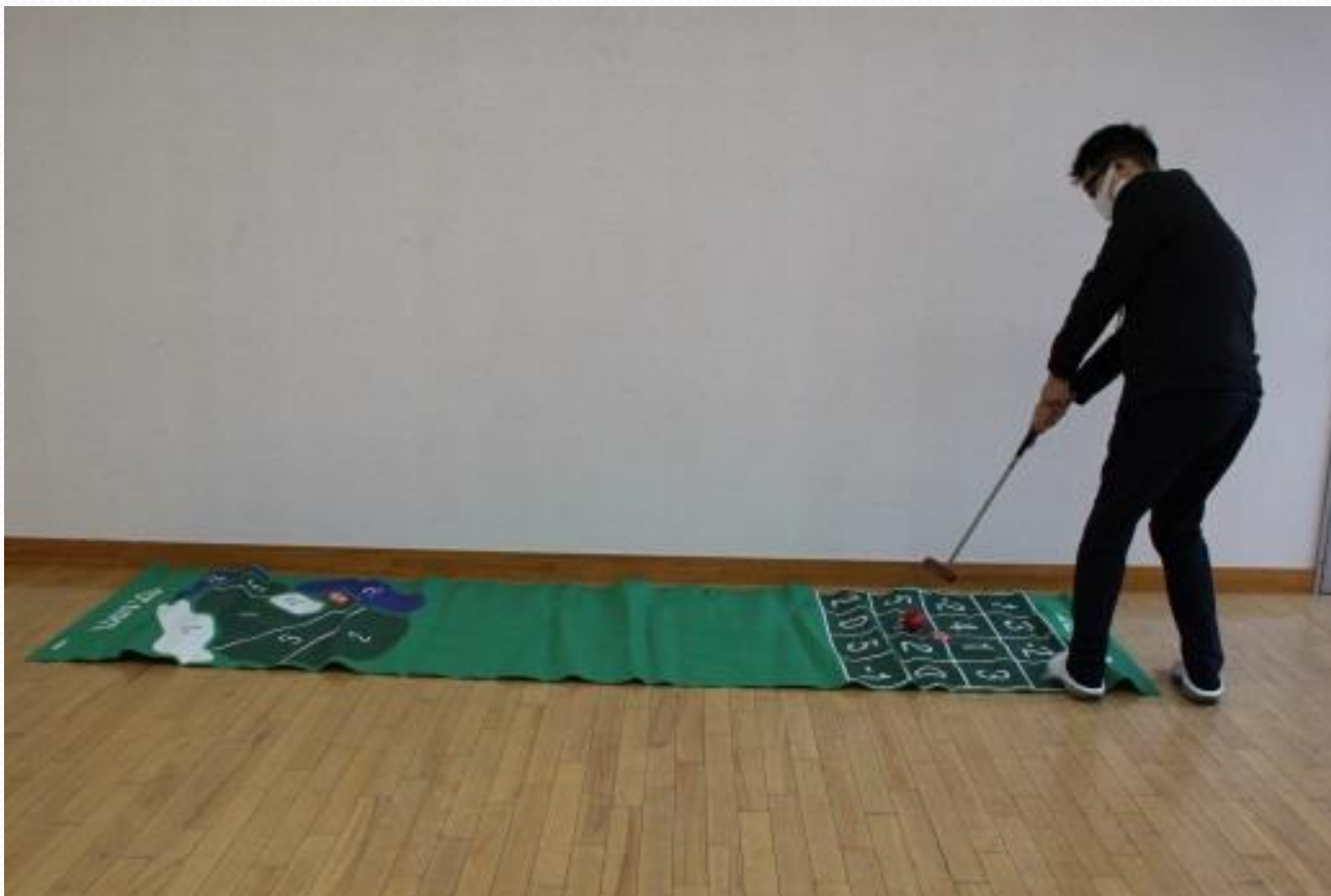
③シャッフルゴルフ