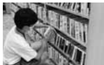
中学生ボランティア講座