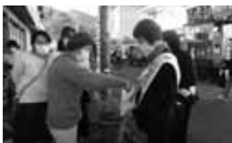
歳末たすけあい募金街頭募金