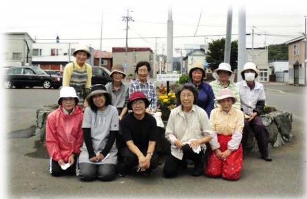
6月13日 由仁ポツポ館前 【日赤奉仕団】