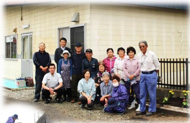
6月14日三川駅前 【三川婦人有志のみなさん】