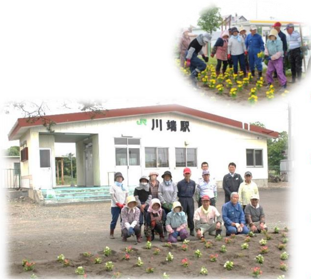
6月14日 川端駅前 【川端交楽会】