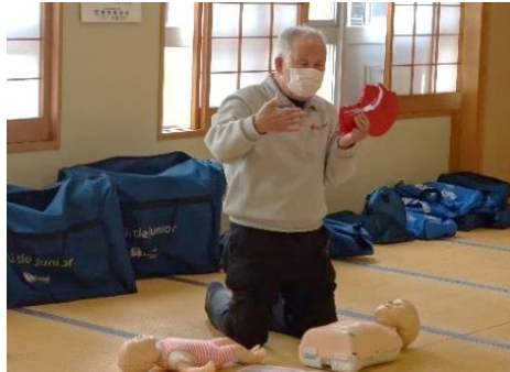
✿日赤指導員による実習