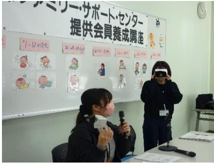
✿保健師による講習

令和6年2月13日（火）提供会員養成講座を開催し、6名の方が受講されました。 保健師による「子どもの発育発達・育児のポイント」や「子どもに起きやすい事故と予防」、 また日赤指導員から「AEDの使い方」「乳幼児救命処置・気道異物除去」等、いざという時に役立つ指導をして頂きました。 新提供会員の皆さま、どうぞよろしくお願いいたします。