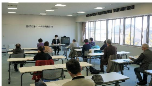
令和4年度 事前研修会