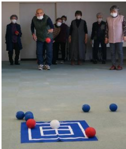
ボッチャで交流を深める東陽ニューカムボールの皆さん。

新型コロナウイルスの影響により、外出や人との接触を控える生活が続いている中で、高齢者等の日常生活能力の低下が起きています。一人暮らしであるいは高齢夫婦世帯の社会的孤立など、多くが外出自粛による閉じこもりがちな生活によるものです。そこで、釧路町老人クラブ連合会では、道老連高齢者相互支援推進・啓発事業を受け、共に生きがいをもつて健やかな日々を送ることを目的に、同じ地域に住む同世代の会員や会員以外の方々に対しても、日ごろ隣人として声かけ運動と共に軽スポーツ、ニュースポーツ、趣味・特技等を活かした活動を通しての交流・友愛活動を行い、外出支援をして行きたいと思えます。