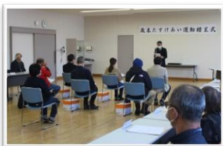
▲歳末たすけあい贈呈式