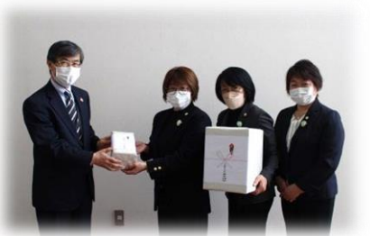
▲JA そらち南女性部様からのタオルの寄贈は、福祉施設等へお届けします。ありがとうございました。