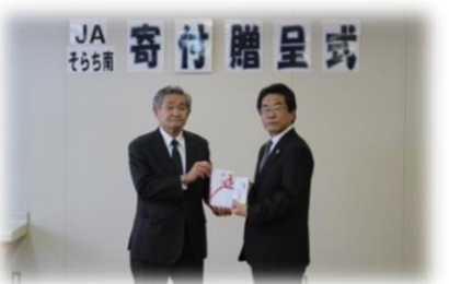
▲そらち南農業協同組合・(株)メリーワーク様から寄付をいただき車いすや歩行器等を購入しました。◀