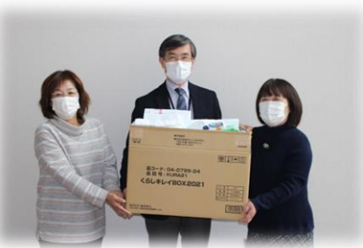
▲由仁町商工会女性部様からのタオルの寄贈は、福祉施設等へお届けしました。ありがとうございました。