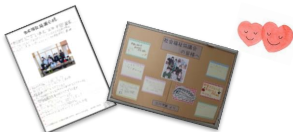
▲由仁地区・三川地区学童クラブから歳末たすけあい見舞金の礼状が届きました。