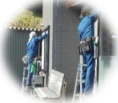
ガラス拭きボランティア