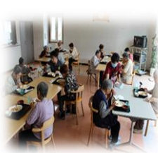
デイサービス昼食