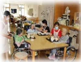
ほほえみの家昼食

結びに、会員であります町民皆様のご多幸を心からご祈念申し上げますとともに、今後ますますのご支援とご協力をお願い申し上げ、ごあいさついたします。