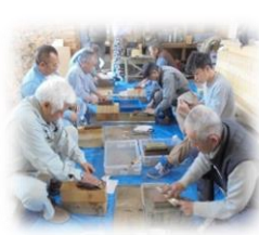
包丁研ぎボランティア