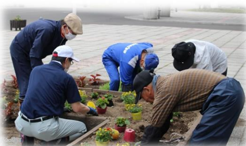
▲げんき館前 老人クラブ連合会(6/11)

今年も各地域とげんき館前の花壇に、ボランティアでベゴニアなど910鉢の苗を植えました。 ご協力いただいたみなさんに深く感謝いたします。