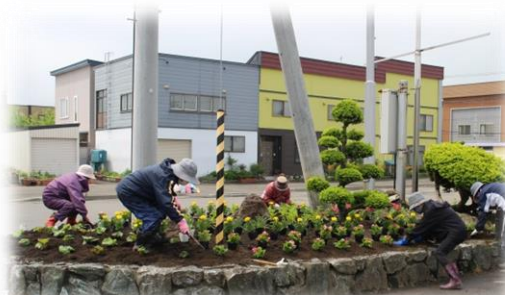
▲ポッポ館前 日赤奉仕団(6/2)