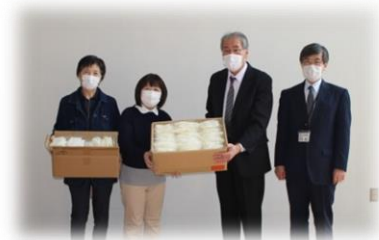
▲由仁町商工会女性部様からマスクの寄贈がありました。 (4/24)