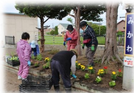
▲三川駅前 三川婦人会(6/8)