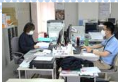
▲ケアマネージャー