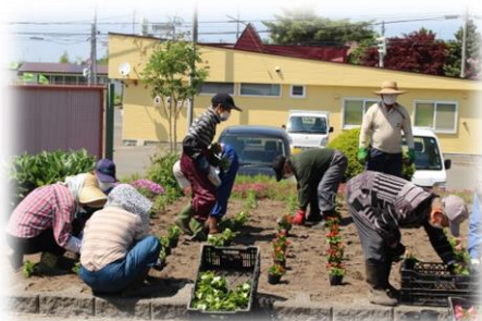
▲川端駅前 川端交楽会(6/1)