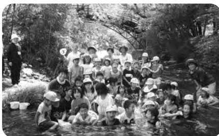
自然体験活動(ネイチャーゲーム)