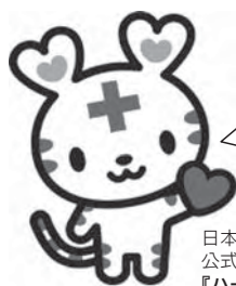
日本赤十字社 公式マスコットキャラクター 『ハートちゃん』