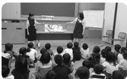
まちたんけん(てるは図書館)