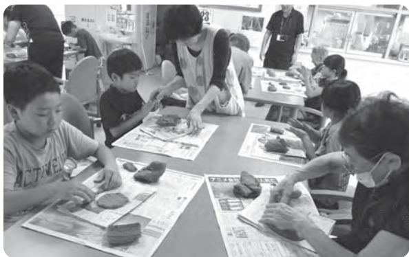
児童館との交流会(陶芸教室)