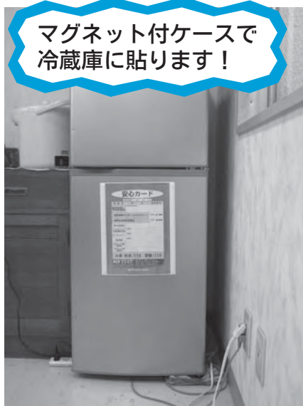
【安心カード地区別登録状況】