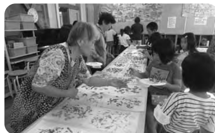
押し花で絵をかこう(イフツツジ会)