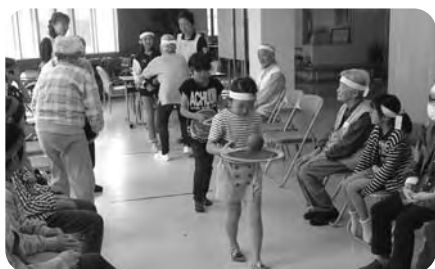
ケアハウスうるおいの里との交流会

綾町児童館は、児童に健全な遊びを与えて、その健康を増進し、又は情操を豊かにすることを目的として平成11年4月1日開館、21年目を迎えています。綾小中学校より徒歩で数分、中央ふれあい公園に隣接と環境にも恵まれ、小学生を中心に1日平均約100名、年間延べ2万7千人程の利用があり異年齢交流の場にもなっています。館内には遊戯室、集会室、図書室、調理室、児童クラブ室があり、全ての児童が気軽に利用でき、サッカー、一輪車、ドッジボールなどいろいろな遊びや、合同オセロ大会、合同ブラバン工作など、児童館と児童クラブの児童の交流を目的とした合同の行事、各施設・団体との交流会、おもちゃ病院、詩吟教室他、さまざまな体験ができる「遊びの広場」です。利用は原則として無料です。