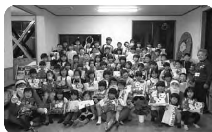
クリスマス会(綾町青年団のサンタさん)