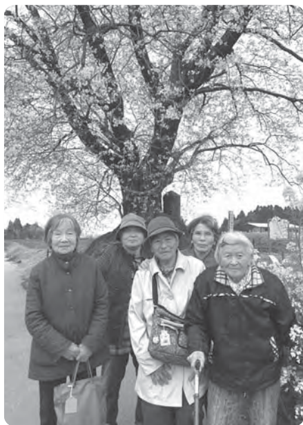
【ドライブ「大坪の一本桜」】

毎週月～金(祝日以外)の9時から16時まで和室がご利用できます。また、お風呂に入って利用者の皆さんとお茶を飲みながら雑談したり、笑ったりと一緒に楽しく過ごしませんか。