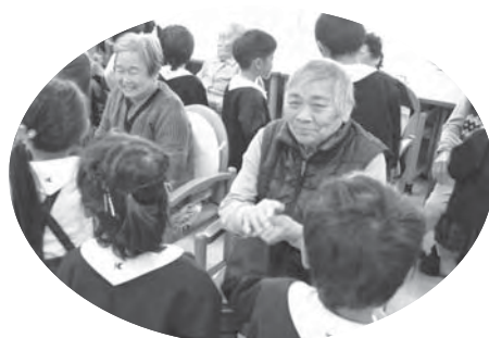
幼稚園との交流会