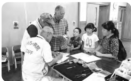
おもちゃ病院(偶数月第3土)