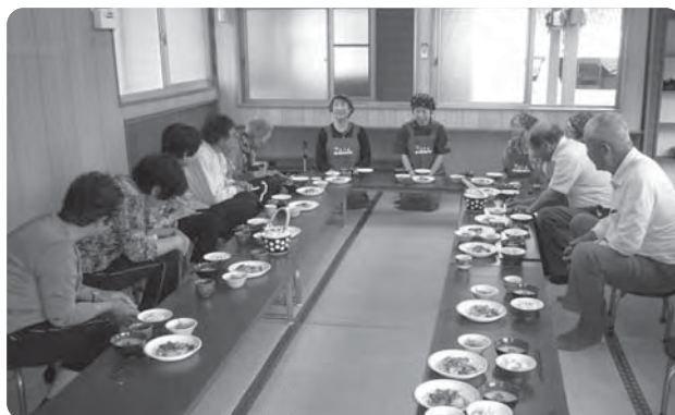
食生活改善ボランティアさんによる会食