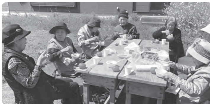
【ドライブ「お茶会 in 尾立」】

外出支援バスもご利用できます。昼食(有料)は注文もできますので、ぜひ一度お気軽に遊びにお越しください。