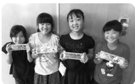
ペンケースを作ろう(夏休み)