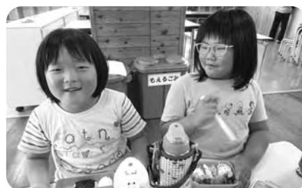
楽しいお弁当の時間です