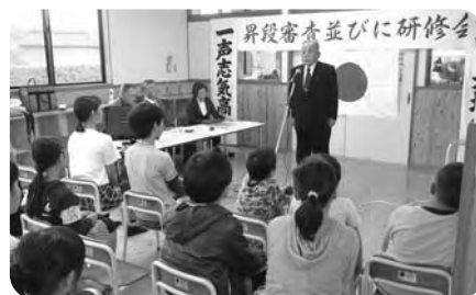
宮崎吟詠会詩吟教室(毎週土)