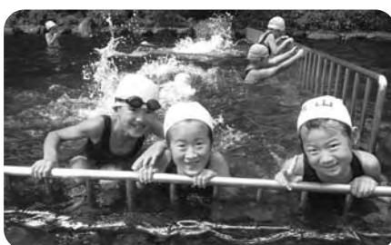
夏はプールが一番!(てるはの森の宿)