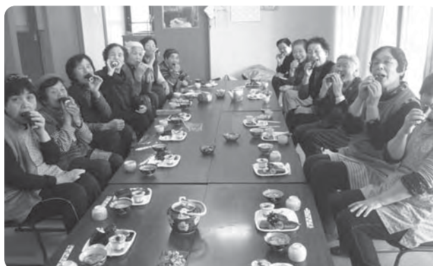
ボランティアさんによる会食