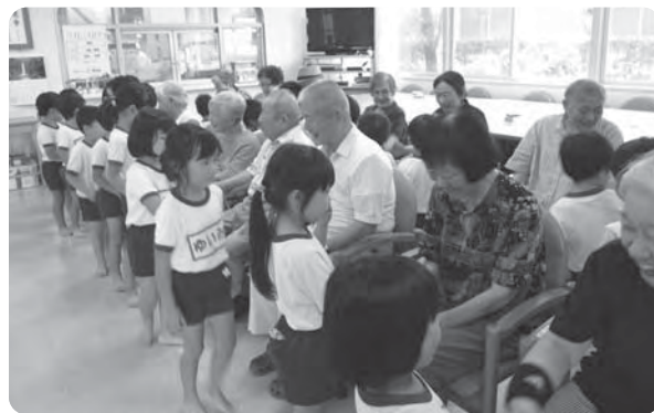
保育所との交流会