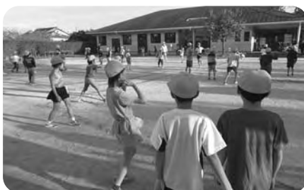
みんなであそぼう(異年齢交流)