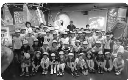
夏休み遠足(宮崎科学技術館)