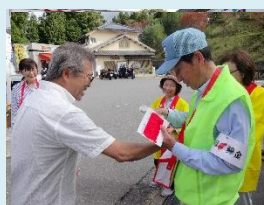
赤い羽根街頭啓発募金