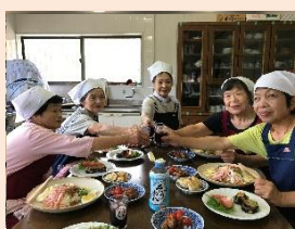
宇地地区サロンひまわりの様子

地区社協が実施する高齢者・子育てサロン、世代間交流や敬老会などの福祉活動のために。