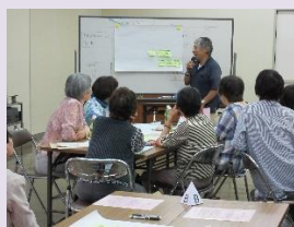
五條市ボランティア連絡協議会 総会の様子