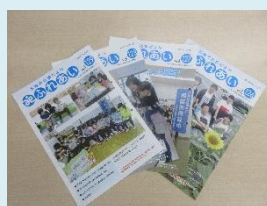
五條市社協だよりの発行

年 4 回発行する広報紙発行費の一部として、地域福祉情報の発信や福祉教育の啓発のために。