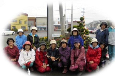
6月5日 由仁ポッポ館前 【日赤奉仕団】