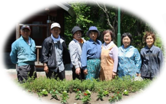
6月3日 三川クレヨンパーク・あかり館・三川駅前 【三川婦人会】