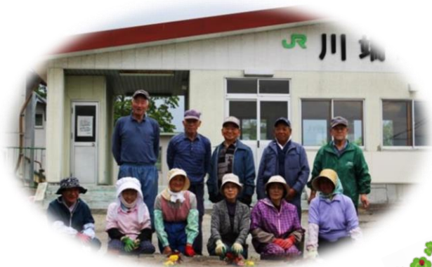
5月31日 川端駅前 【川端交楽会】

今年も、由仁・三川・川端地区の駅前花壇ほかに、800鉢の花の苗を植えていただきました。花を植えたことで町の中がとても明るくなりました。ご協力いただいたみなさんに心より感謝いたします。