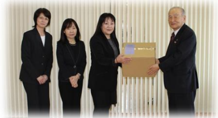
▲南空知地区郵便局長夫人会様(12/3)