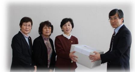
▲JA そらち南女性部様(3/8)

いただいたタオル・そうきんは、保育園等へお届けしました。ありがとうございました。