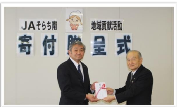
▲そらち南農業協同組合・(株)メリーワーク様からご寄付をいただき車いす等を購入しました。(1/24)