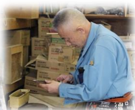
▲由仁町技能協会の皆さん、ありがとうございました。(3/20)