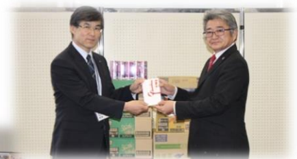
▲北海道コカ・コーラボトリング(株)様からの飲料の寄贈は、町内の福祉施設へお届けしました。(12/5)

いただいたタオル・そうきんは、保育園等へお届けしました。ありがとうございました。