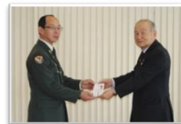
歳末たすけあい運動贈呈式