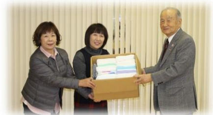
▲由仁町商工会女性部様(12/6)