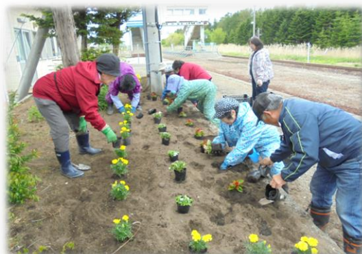
5月28日 三川駅前 【三川婦人会】