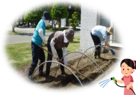
▲デイふぁーむ風景

前号 112 号掲載後、皆様から寄せられたご厚意をお知らせします。 心より厚くお礼申し上げます。 (順不同・敬称略)