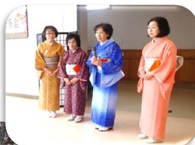
▲ たの 嬬やかにわかくさ茶会 (4/12)