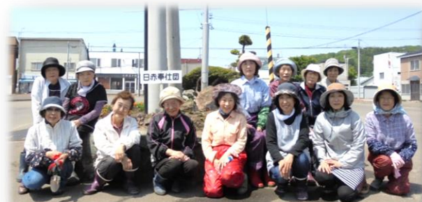
6月4日 由仁ポップ館前 【日赤奉仕団】