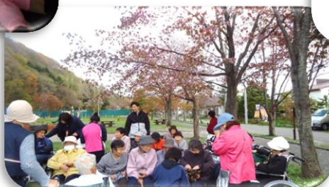
▼栗山公園にお花見に行きました。 (5/8~5/11)