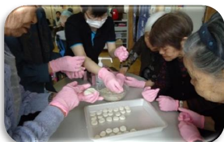
▲“もぐもぐタイム”のお菓子づくり (4/24~4/27)