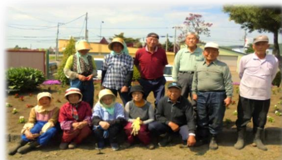
5月30日 川端駅前 【川端交楽会】