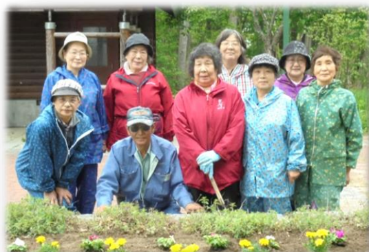
5月28日 三川クレヨンパーク 【三川婦人会】