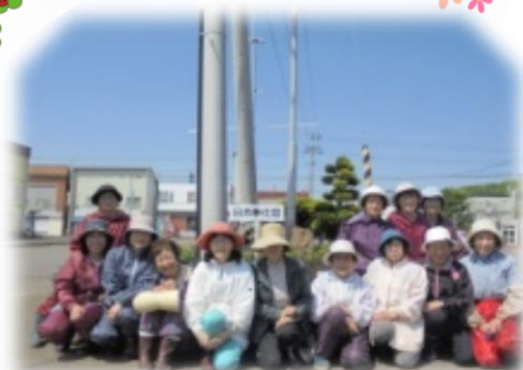
▲由仁ポッポ館前[日赤奉仕団] (5/29)