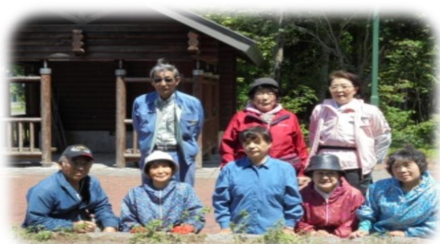
▲三川クレヨンパーク[三川婦人会] (6/12)