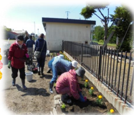
▲三川駅前[三川婦人会] (6/12)