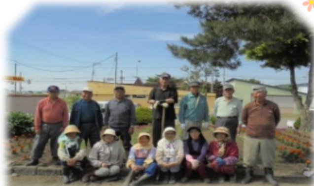
▲川端駅前[川端交楽会] (5/30)