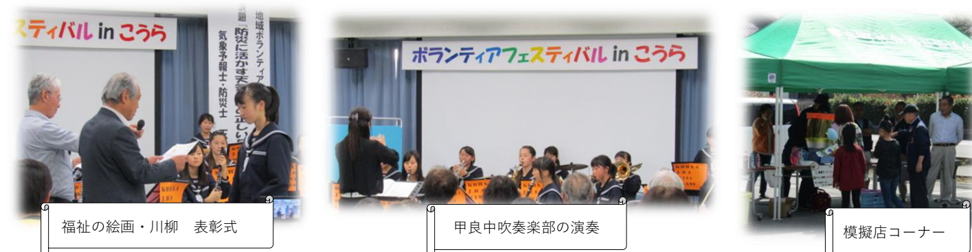
福祉の絵画・川柳 表彰式