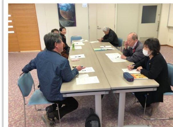
サポーター連絡会の様子

“トライアングル”の支援の輪がひろがり、甲良町がひとつの家族となるような町づくりをめざして、甲良町社会福祉協議会はこれからも、地域福祉活動をすすめていきたいと考えています。