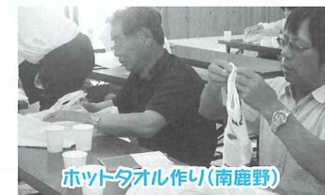
ホットタオル作り（南鹿野）