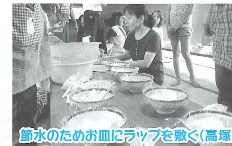
節水のためお皿にラップを敷く（高塚）