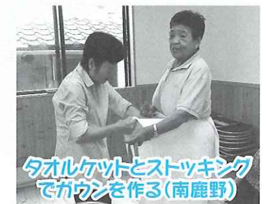
タオルケットとストッキングでガウンを作る（南鹿野）