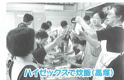
ハイゼックスで炊飯（高塚）