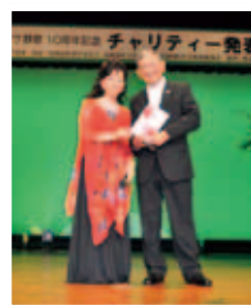
「10周年記念 チャリティ発表会」 記念事業として

南条マジック愛好会 様 2件 カラオケ静歌 代表 高嶋 静江 様 300,000円