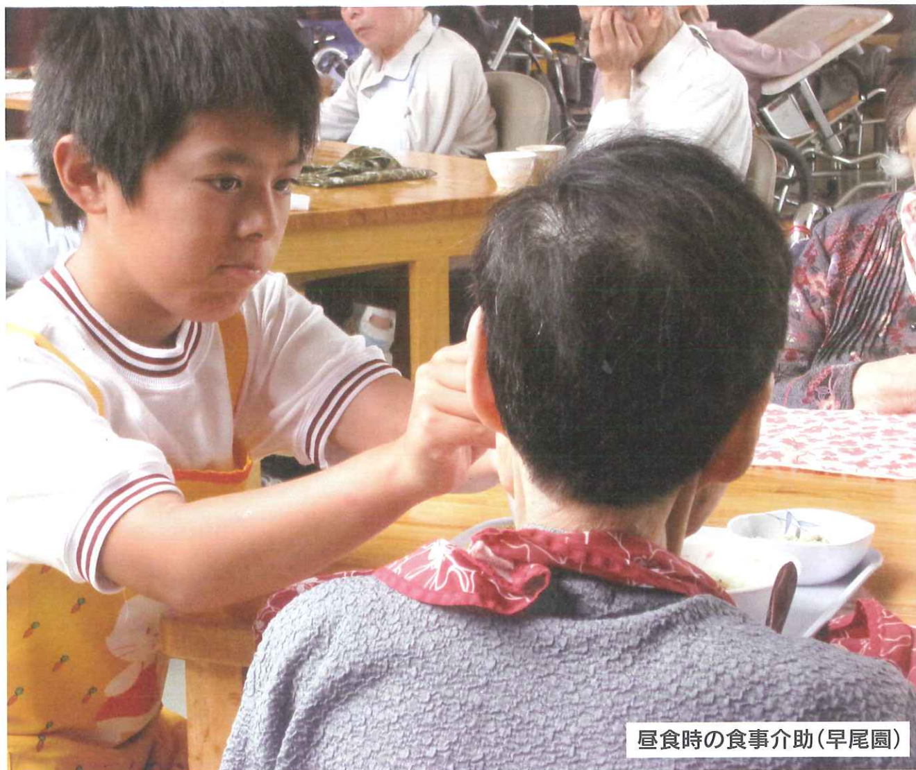
昼食時の食事介助(早尾園)