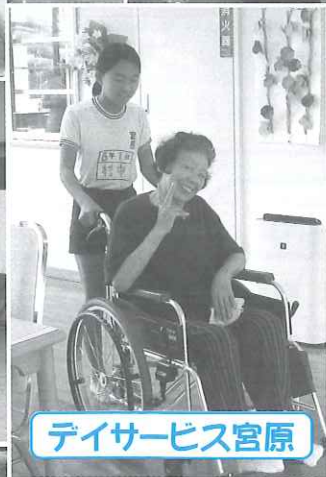
デイサービス宮原