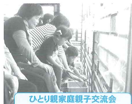
ひとり親家庭親子交流会 大分アフリカサファリ

共同募金運動で寄せられた浄財は、全額熊本県共同募金会に送金し、募金額の約66%が地域福祉活動の事業費として氷川町社会福祉協議会に配分されます。残りの34%は広域的な課題を解決するための活動費として、熊本県内において使われています。また、大規模な災害が起こった際の備えとして、各都道府県の共同募金会では、募金額の一部を「災害等準備金」として積み立てています。この積み立ては、大規模災害が起こった際に、災害ボランティア活動支援など、被災地を応援するために使われています。