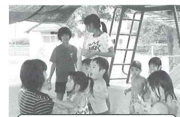
児童・生徒ワークキャンプ