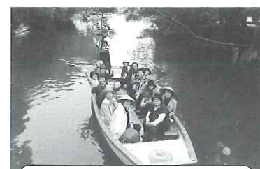
ひとり暮らし高齢者交流会

各地区の募集員さんが皆様のご自宅を訪問いたしますので、ぜひ社協会員にご加入頂きますよう、ご理解とご協力をお願い致します。