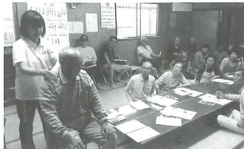
災害時高齢者支援講習(法道寺)

また、日本赤十字社では、活動の充実を図るための資金確保に向け、預金口座振替によるご協力をお願いしています。加入申込書を竜北福祉センター及び、宮原福祉センターに備え付けておりますので、あわせてご協力をお願いいたします。