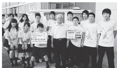
▲ボランティア活動後にみんなでパチリ☆▼