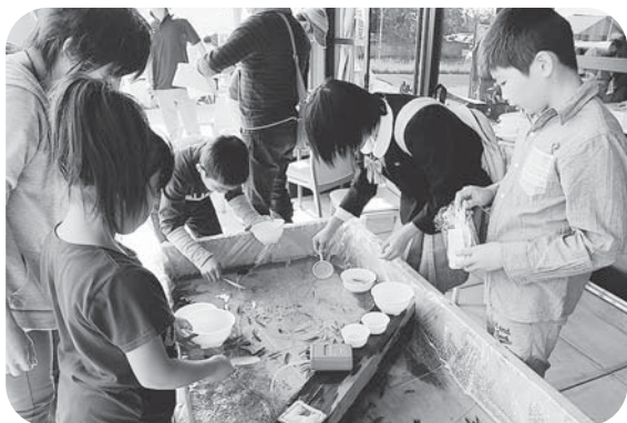
▲クローバーハウスの魚すくいコーナーは今年も子どもたちに大人気でした!!

会場内では福祉作文・ポスターコンクール表彰式、町内幼稚園・小学校や各種団体・ボランティアグループの皆さんによるステージ発表、町内の福祉施設による展示販売が行われました。また、屋外ブースでは地元青年会の皆さんによる餅つき体験や共同募金コーナーなど、福祉に関するさまざまな催しが行われた楽しい秋の一日となりました。