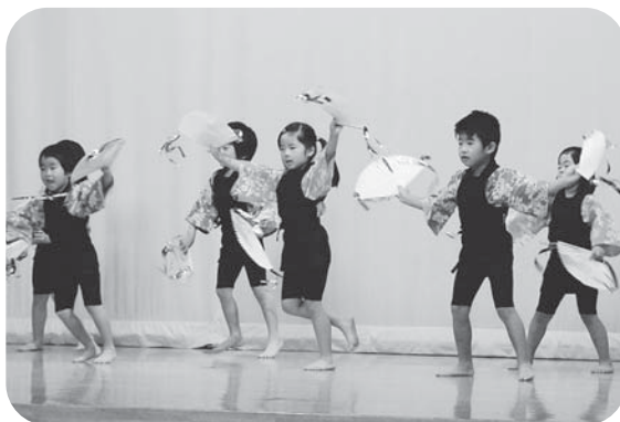
▲元気いっぱい! かわいいすずめ踊り♪ (ふれあい発表会・みやざき園のみなさん)