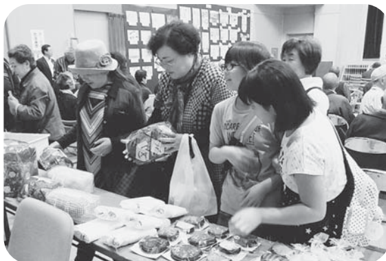
▲町内の福祉施設で作られている授産品販売 コーナーも、多くの人で賑わいました。