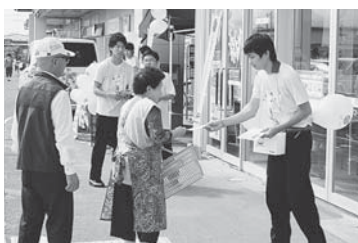
▲高校生の皆さんが大活躍！若い力が活動を引っ張ります♪▲