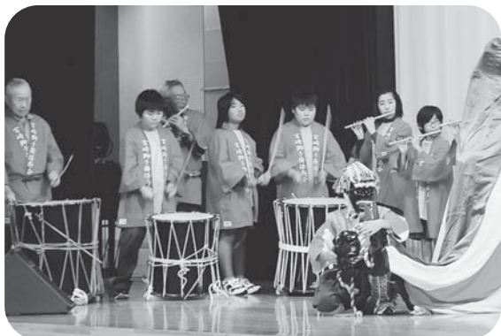
▲宮崎小児童と獅子舞保存会の皆さんによる 宮崎地区伝統芸能の獅子舞 (ふれあい発表会)