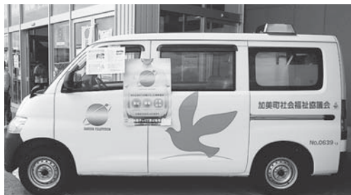
▲昨年贈呈された入浴車も展示しました。

元気な声に多くの皆様が足を止めて下さり、募金総額は91,424円となりました。なかには開始時間ちょうどに、ペットボトルいっぱいにお金を入れてくれた男の子の姿もありました。