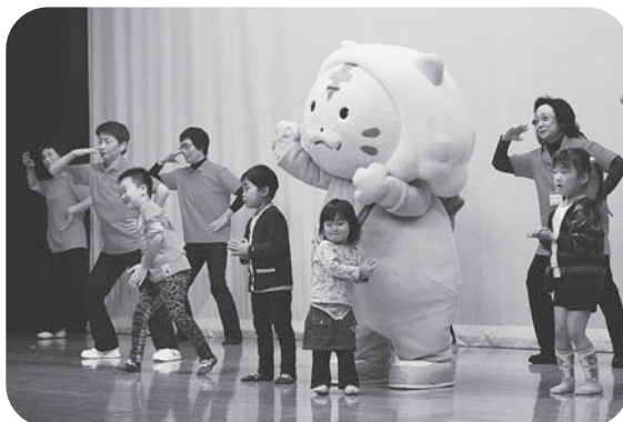
▲加美町公認キャラクター「かみ〜ご」登場! 子どもたちと一緒に楽しく体操しました♪