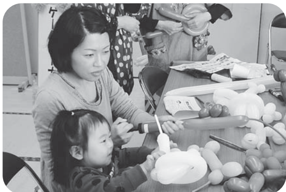
▲バルーンアートに挑戦! 上手にできるかな? (ボランティア友の会コーナー)