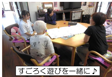
すごろく遊びを一緒に♪

お忙しい中、受け入れにご協力頂いた大一会の各施設の職員の皆様、有り難うございました。また、来年もサマーボランティアを実施予定です！☆ 中高生の皆さん、今年参加出来なかった方も来年はぜひぜひ！ご参加してみませんか！？☆