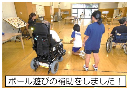
ボール遊びの補助をしました！