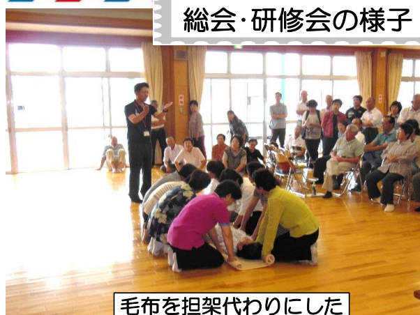
毛布を担架代わりにした 要救護者 搬送訓練