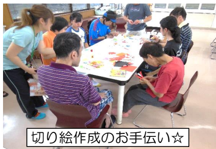
切り絵作成のお手伝い☆