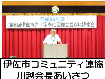
伊佐市コミュニティ連協 川越会長あいさつ