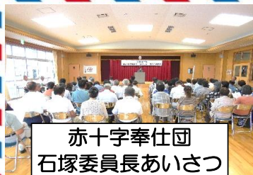
赤十字奉仕団 石塚委員長あいさつ