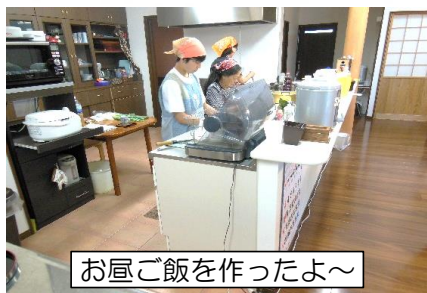
お昼ご飯を作ったよ～