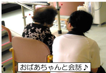
おばあちゃんと会話♪