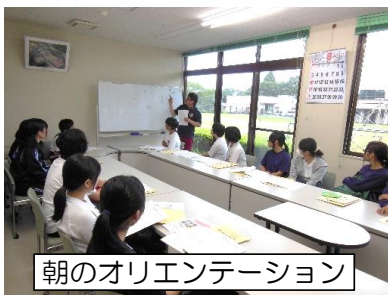
朝のオリエンテーション

毎年恒例で受け入れてくださる社会福祉法人 大一会様の各施設での福祉ボランティア体験。今年は17名の中高生が参加しました！最初は緊張一杯で言葉少ない様子でしたが、徐々に慣れ、短い1日体験の中でも少しずつ、どの生徒さんも各々何かを感じてもらえながら、体験が出来たようでした☆