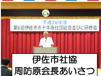
伊佐市社協 周防原会長あいさつ