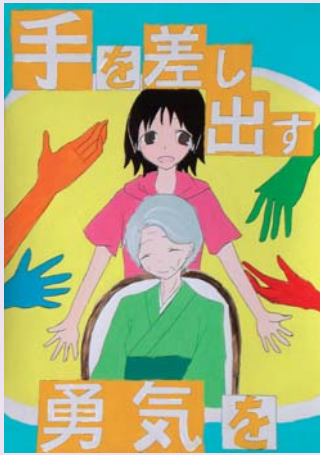
【中学生の部・優秀賞】 『手を差し出す勇気を』