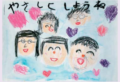
【幼児の部・優秀賞】 『やさしくしようね』