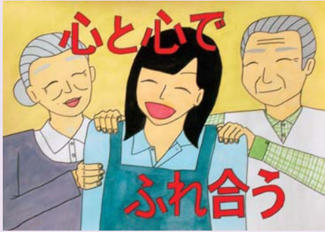
【中学生の部・優秀賞】 『心と心でふれ合う』