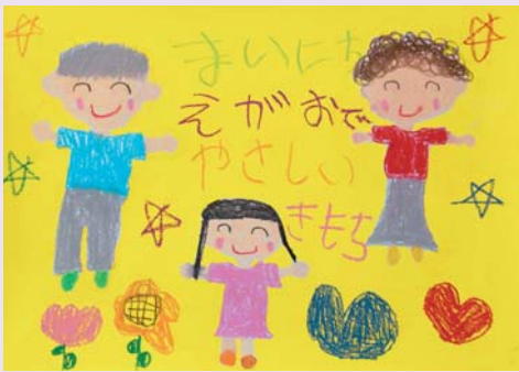
【幼児の部・優秀賞】