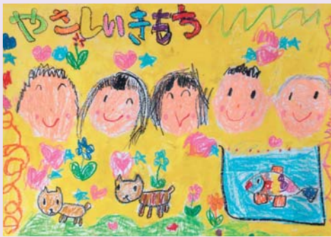
【幼児の部・優秀賞】