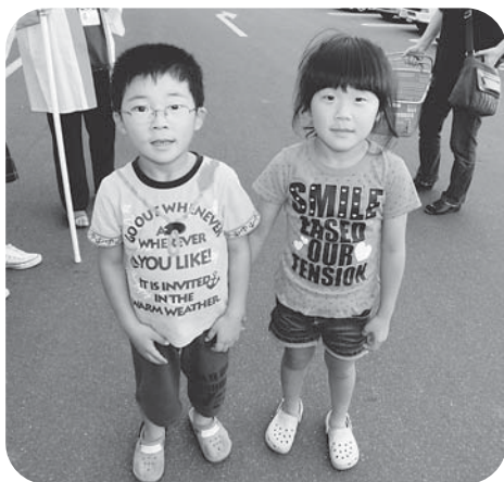
「赤い羽根をもらったよ!」

今年度も10月1日から全国一斉に、赤い羽根共同募金運動が開始されました。中新田地区でも去る10月1日、民生委員さん方のご協力の下、ヨークベニマル中新田店・ウジエスーパー中新田店・イオンスーパーセンター加美店の店頭をお借りして街頭募金が行われました。