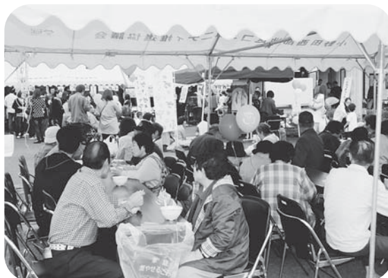
▲今年も多くの皆さんで賑わいました。