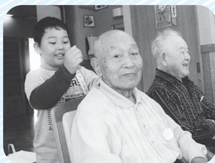
▲これぞ「孫の手」! ああ～いいごだ～♪

元気いっぱいのダンス発表に始まり、肩たたきで交流したのち、子どもたちからたった今描いたばかりの似顔絵がプレゼントされ、めんこい孫たちからの贈り物に、利用者の皆さんは一樣にとっても嬉しそうな表情を浮かべていました。宮崎小学校の皆さん、ありがとうございました。是非また来て下さいね!お待ちしております!!