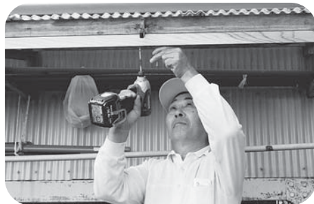
▲プロの技術でしっかり補修