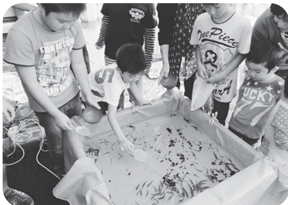
▲クロアーバーハウスの魚すくいは子供たちに大人気！