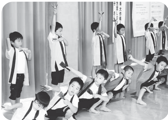
▲元気いっぱいのよさこいでスタート♪ （おのだひがし園のみなさん）