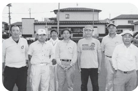
▲ご協力いただいた7名の大工さん

作業の完了したお宅からは、「不便だと思っていたが直せなかった部分なので、本当に助かりました!」と感謝の声が寄せられました。