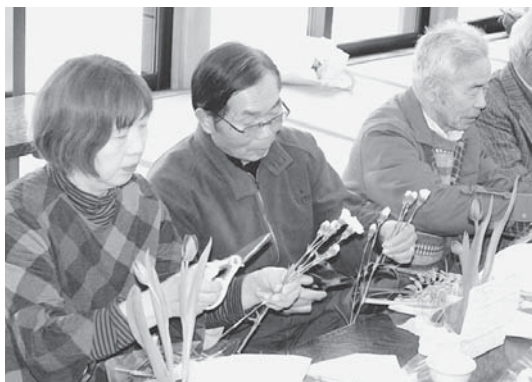
▲男性陣も奮闘中！ 「さ～て、なんぼ切っかなあ？」

閉会後には「まだしばらく寒いけれど、春の花を眺めることで気持ちが明るくなる」「花の少ないこの時期に、こんなにきれいな花を見るだけで癒される」などの声をいただきました。チューリップやガーベラなどの春の花を眺め、参加者の皆さんは一足早い春を感じながら、日頃の介護の疲れがいやされたようでした。