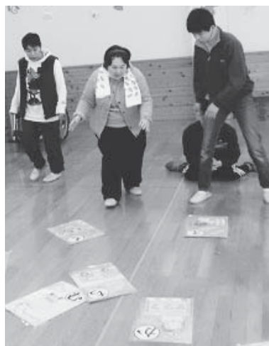
▲お目当てのカルタ目指して走れ～

なかでも一番の盛り上がりは、手作りの特大カルタ取り。床一面に置いたカルタの争奪戦に、笑いあり、涙（笑いすぎによる）ありの内容で、今年もたくさんの福が皆さんに訪れそうな交流会となりました。