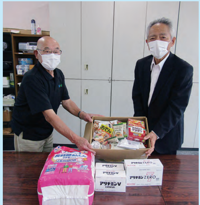
加美町中新田B&G海洋センター様から「海ごみゼロフェスティバル」の参加者から提供いただいた食品を届けていただきました！