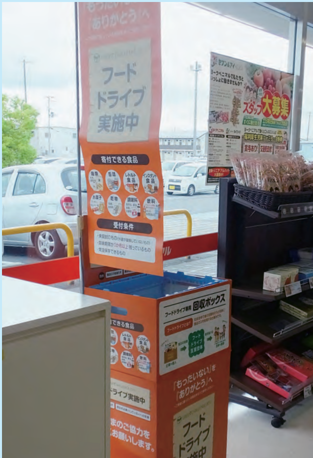
回収ボックスはヨークベニマル中新田店のサービスカウンター前に設置してあります