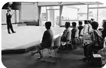
▲介護予防シニア元氣塾