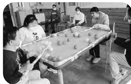
▲やくらいアットハウス