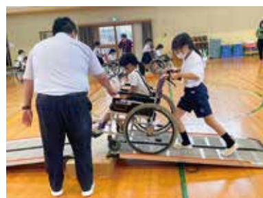
↑ 安全な介助のための声かけやブレーキをかけるタイミングなどを学ぶ