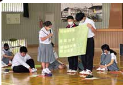
↑ 高齢者に対するイメージや、高齢者のために何ができるかを発表