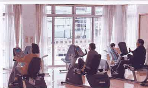
らく楽自主トレーニング