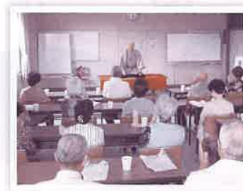
ふれあいいきいきサロン