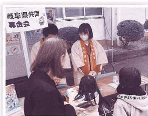
街頭募金(赤い羽根共同募金)