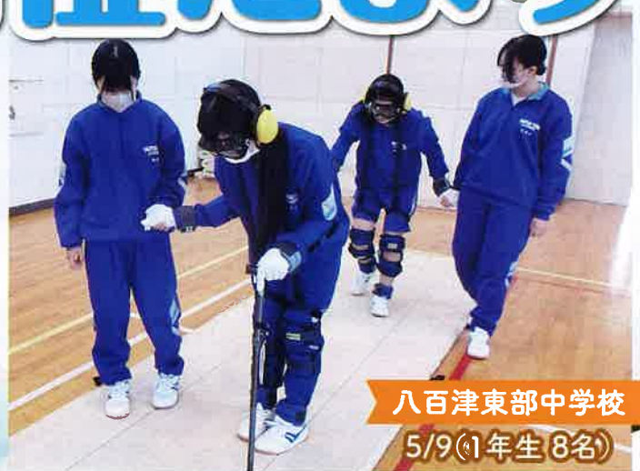
八百津東部中学校