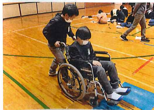
車イス体験／由良小学校6年生

「段差や道が悪いところがあると大変。物をとるのがむずかしい。乗っている人の気持ちを考えながら介助しないとけない」「新聞がみにくい、階段がのぼりにくい」と声がありました。 手話体験では、ろう者の方の気持ちや、手話や筆談等の