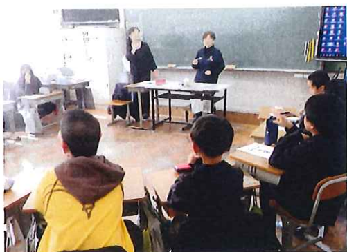
手話体験／由良小学校4年生

福祉教育を通じた地域づくりをすすめていくには、学校だけでなく、地域全体で一緒に考え支え合っていくことで、周りの人への思いやりの心を育み、自分も誰もがしがあわせになるための「共に生きる」福祉教育が大切です。 今回、由良小学校で車イス体験、高齢者疑似体験、手話体験をしました。