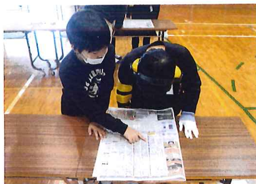
高齢者疑似体験／由良小学校4年生

福祉教育を通じた地域づくりをすすめていくには、学校だけでなく、地域全体で一緒に考え支え合っていくことで、周りの人への思いやりの心を育み、自分も誰もがしがあわせになるための「共に生きる」福祉教育が大切です。 今回、由良小学校で車イス体験、高齢者疑似体験、手話体験をしました。