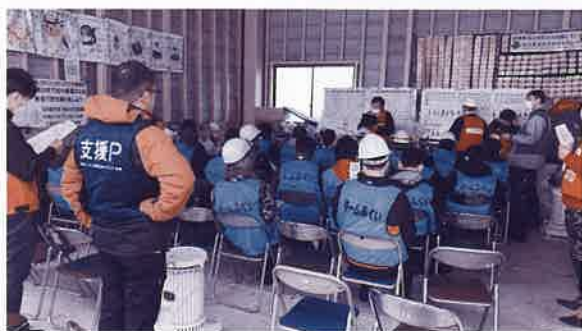
【災害VC】オリエンテーションの様子

現在も多くのボランティアが継続的に活動していますが、未だに断水中の地域も多く、倒壊したままの建物が残っており、復興にはまだ多くの支援が必要です。