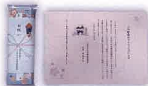
鉛筆のセットを 贈呈しました