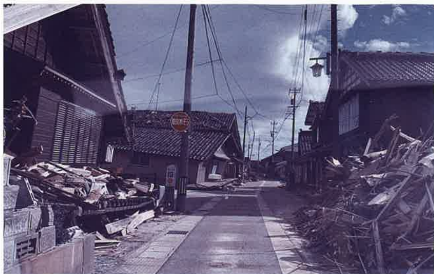
珠洲市内の被災状況

令和6年1月1日16時10分 石川県能登地方を震源とするマグニチュード7.6(最大震度7)の地震によって被災した珠洲市社協を支援するため、本会から2月22日から29日まで職員1名を派遣しました。