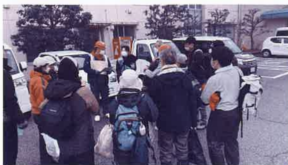
【災害VC】現場出発前の打ち合わせ