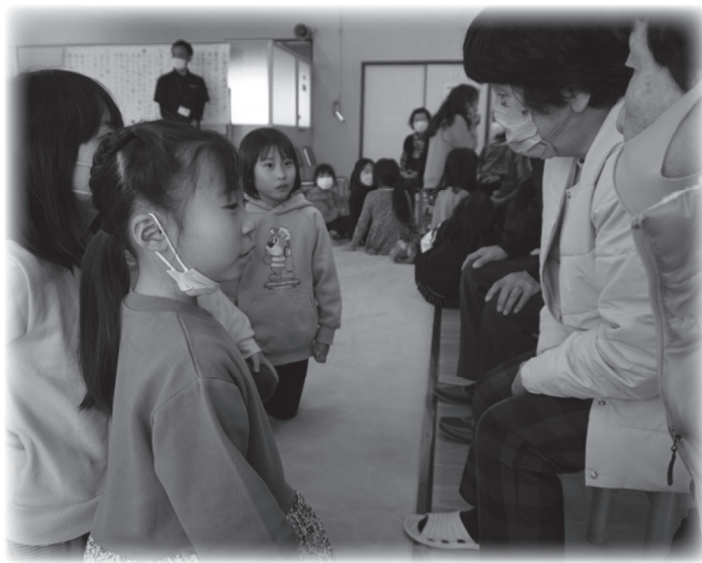
高齢者との交流のの様子

「やすらぎ荘」を訪問し、高齢者の方々と体操やゲームをして交流しました。子どもたちは「365歩のマーチ」をととても気に入ったようで、「ワンツー！ワンツー！」と元気に一緒に体操をしました。歌の発表や連想ゲームを通してふれあい、おじいさんおばあさん方に笑顔を届けることができました。