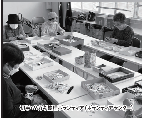
切手・ハガキ整理ボランティア(ボランティアセンター)