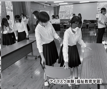
アイマスク体験(福祉教育学習)