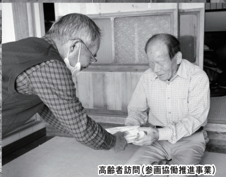
高齢者訪問(参画協働推進事業)