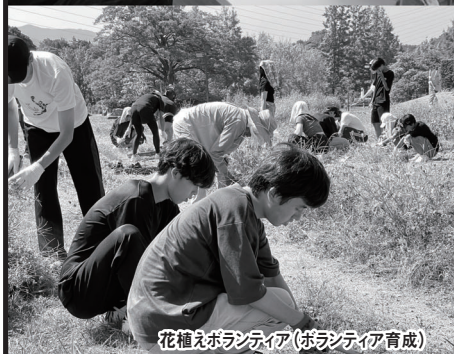
花植えボランティア(ボランティア育成)