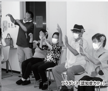
フラダンス(認知症カフェ)