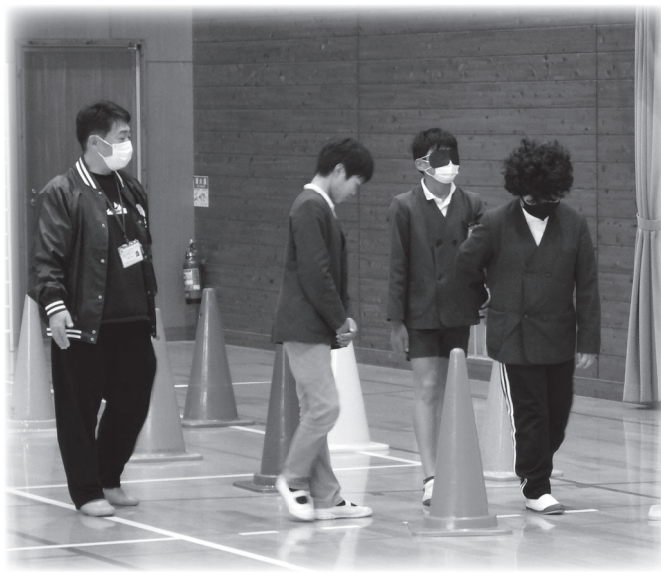
ガイドヘルプ体験学習の様子

鮎川小学校では、今年度も5年生が総合的な学習の時間に福祉体験学習を行いました。12月には視覚障がいについてゲストティーチャーからお話を伺い、自分たちにできることについて考えました。社会福祉協議会の方には、ガイドヘルプの仕方を教えていただきました。2月には、聴覚障がい理解についても学習しました。