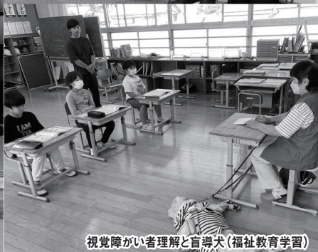
視覚障がい者理解と盲導犬(福祉教育学習)