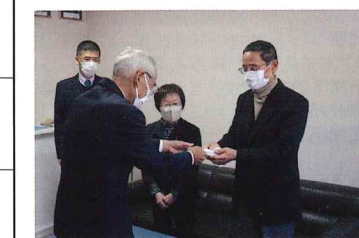
長期施設入所者見舞金配分