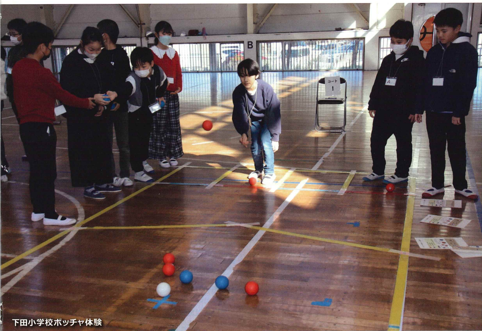
下田小学校ボッチャ体験