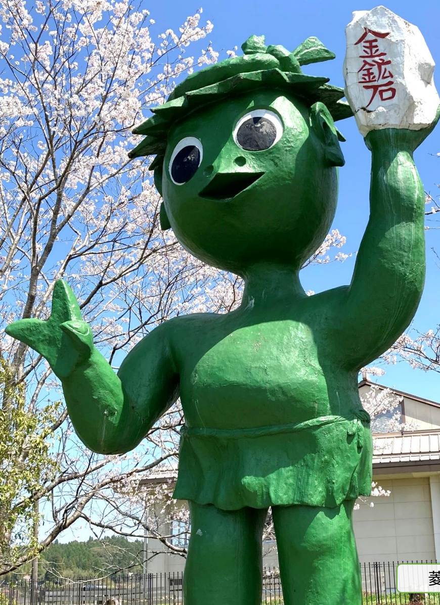
菱刈中学校前のガラッパ像

編集・発行: 社会福祉法人 伊佐市社会福祉協議会 【菱刈本所】伊佐市菱刈前目711-1(まごし館) TEL:0995-26-4120 FAX:0995-26-4783 E-mail:kotob019@po.minc.ne.jp 【大口支所】伊佐市大口里3054-1(大口元気こころ館) TEL:0995-23-0011 FAX:0995-23-0135 E-mail:ookuchicityshakyou@violin.ocn.ne.jp