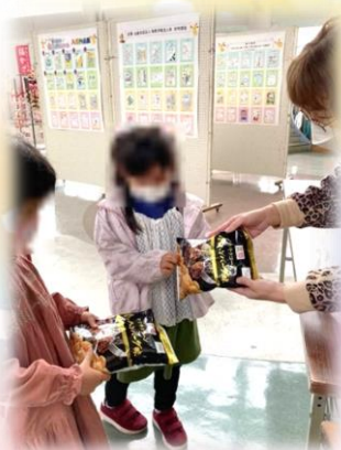
みんなでごはんの会