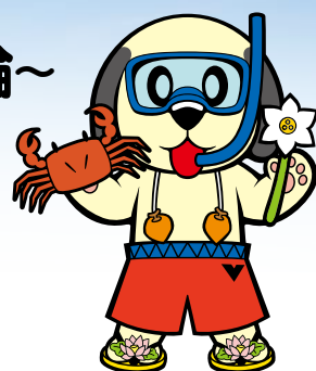
南越前町ランティー