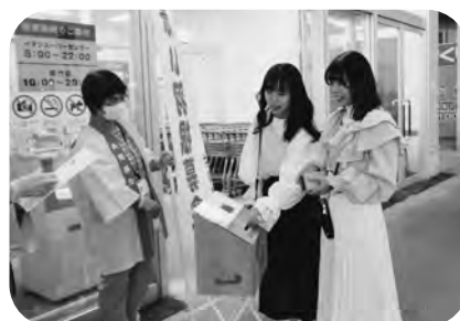
▲赤い羽根共同募金運動