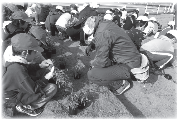
花つぼみの方と花の苗植え活動

今年も、バイパスの近くの花壇と、ひがし公民館前の花壇の2箇所に植えました。バイパスを通る人や公民館を利用する人に喜んでもらえるとうれしいです。