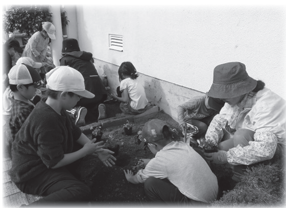
地域の方と花の苗植え活動

今年は、パンジーやビオラ、チューリップなどを植えました。子どもたちは、「きれいに植えることができたのでうれしー。」と喜んでいきます。しっかりととお世話を続け、地域の人たちにも喜んでもらいたいです。