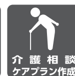
介護相談 ケアプラン作成