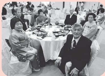
▲みなさんおめでとうございます。 これからもお元気で!!