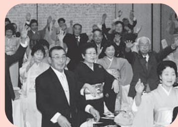
▲金婚を祝して万歳！