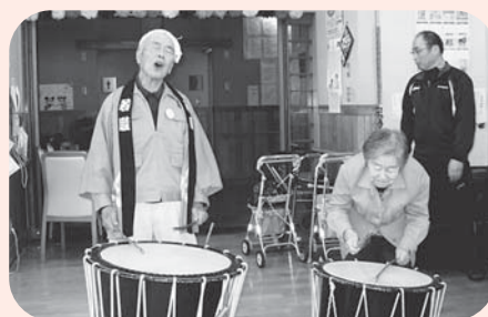
▲あ〜、うまぐいがねな〜

発表後には、サンタに扮した利用者さんから一足早いクリスマスプレゼントが手渡されました。