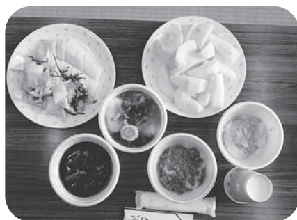
▲地元の食材を活用して、 あんこ、納豆、ずんだ もち、お雑煮が完成！

これは、町民提案型まちづくり事業の一環として、中新田ボランティア友の会が企画し、実現した催しで、もちつきと会食を通じ、地元のボランティアと加美町へ避難されている方々との交流を深める良い機会となりました。