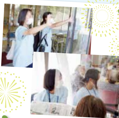
デイサービス体験