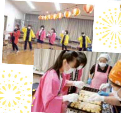
盆踊り大会行事体験