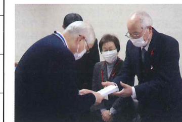
長期施設入所者見舞金配分