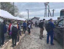
静岡市清水区でのボランティア活動の様子