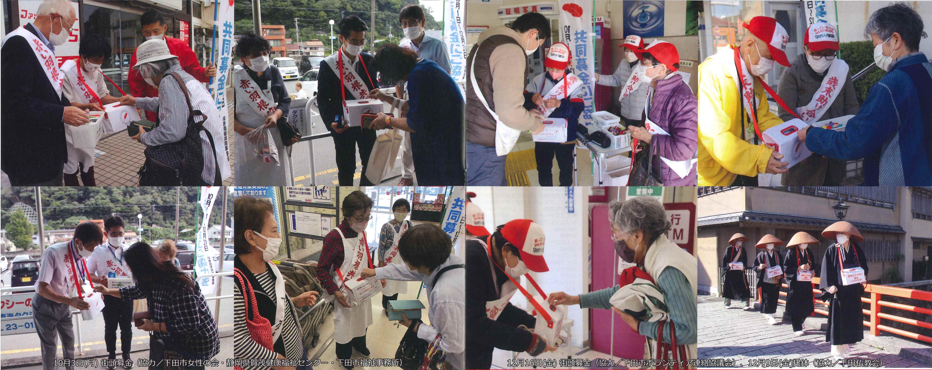
10月3日(月) 街頭募金 (協力/下田市女性の会・静岡県賀茂健康福祉センター・下田市福祉事務所)