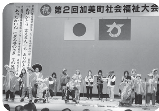
▲総勢40名による迫力の音楽発表

また、第10回福祉作文・ポスター・標語コンクール入賞者の発表も同時に行われ、67名のみなさんに賞状が授与されました。