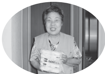
▲とても喜んでいただきました。

いただいた冷凍めんはデイサービスセンターや障害者自立支援事業所の昼食に使用したほか、配食サービス（弁当宅配）の利用者さんへお配りしました。