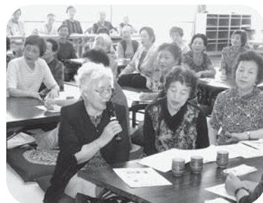
▲会場は満員御礼！(59名が参加)