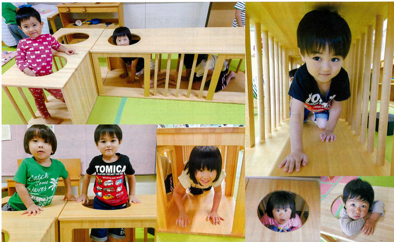
子ども子育て支援事業（R3 新規事業）の助成金を活用して購入した“木のトンネル”で遊ぶ子どもたち（R4.8.9 三戸保育園）

住み慣れた地域で、だれもが安心して暮らせるような福祉社会をめざしてがんばります!!