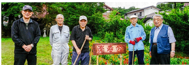
7/7 には花壇の前に看板を設置しました

写真は下目時地区の老人クラブ、楽寿会(らくじゅかい)が6月4日(土)に下目時八幡宮で行った奉仕活動の様子。この日は会員16名が参加し、サルビアやマリーゴールドといった初夏から秋まで楽しめる花、およそ300本を植えました。