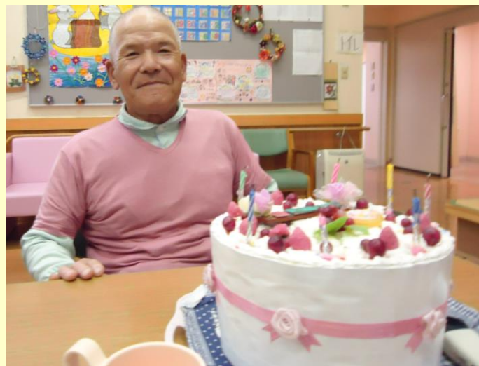
▲利用者さんの誕生日にはみなでお祝い♪ いつまでもお元気で！