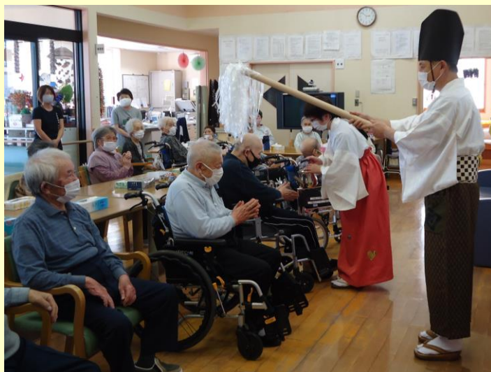
▲季節ごとの行事もいっぱい！職員も盛り上げます！ この日は神主さん登場！いいことがありますように♪