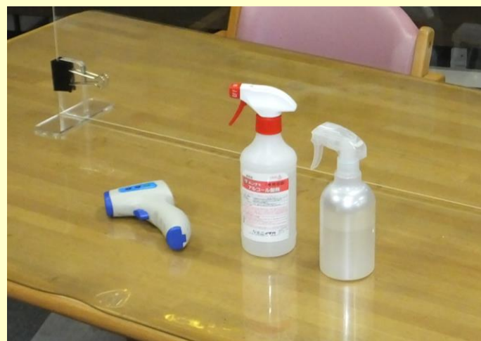
▲非接触型体温計による検温と、こまめな消毒作業を 毎日定期的に行っています。