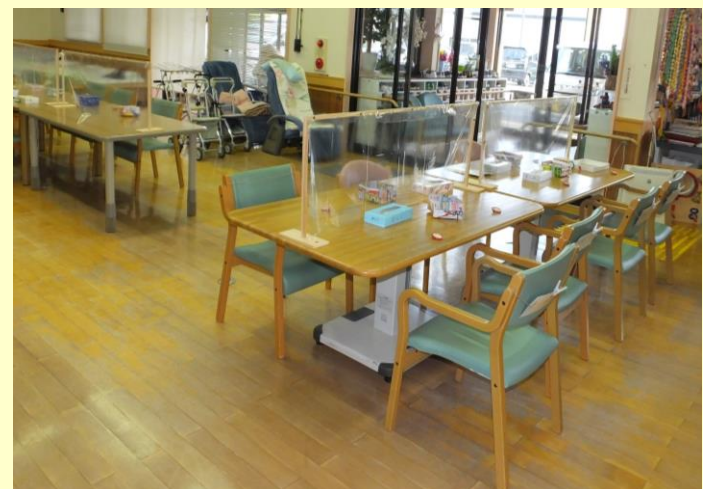
▲対面する利用者さんとの間には、アクリル板や ビニールシート等の仕切りを設置しています。

当施設では毎日、感染症対策を十分に行っています。 皆様のご利用をお待ちしております。 見学等、利用に関するご相談は下記までお気軽に♪ 随時対応致します！