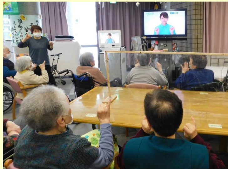
▲新たにレクリエーション機材を導入しました♪ 日々の機能訓練や認知機能維持に活躍中！！