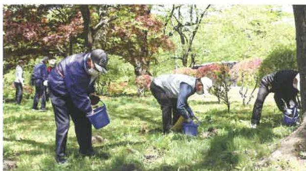
桜の木への施肥の様子