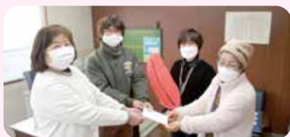
商工会青年部・女性部よりご寄付