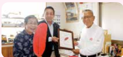
田中陸運株式会社に感謝状贈呈