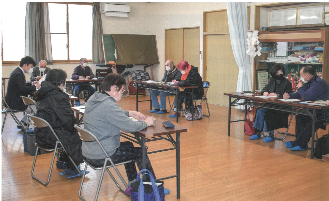
ご高齢の方などを見守る、ほのぼの見守りネットワーク事業 元木平町内会での情報交換会の様子 (R4.3.10 元木平町内会館)

住み慣れた地域で、だれもが安心して暮らせるような福祉社会をめざしてがんばります!!